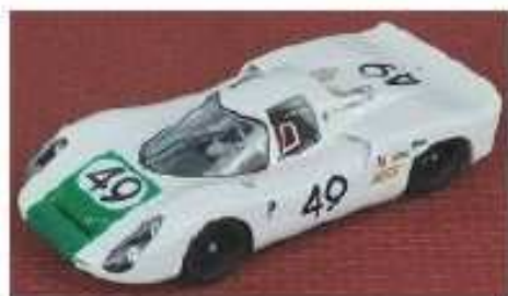
SRC Porsche 907K

Amnesso sostituzione assale con cerchi e gomme della Fly