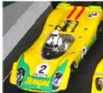
FLY Porsche 908