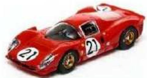
SCALEXTRIC Ferrari P4