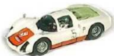
FLY Porsche Carrera 6