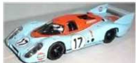
FLY Porsche 917 LH