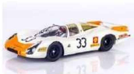
SRC Porsche 908L (1968)

Amnesso sostituzione assale con cerchi e gomme della Fly