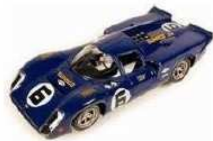
FLY Lola T70 Ammissa la rimozione della ruota di scorta