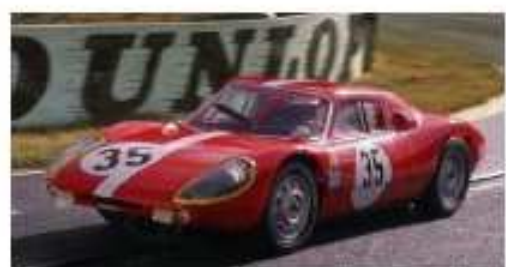
MRRC Porsche 904 GTS