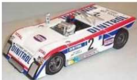
FLY Chevron B19 - B21