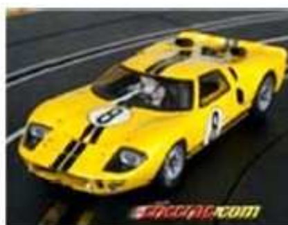
FLY Ford GT40 MKII