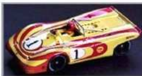
FLY Porsche 917 Spider