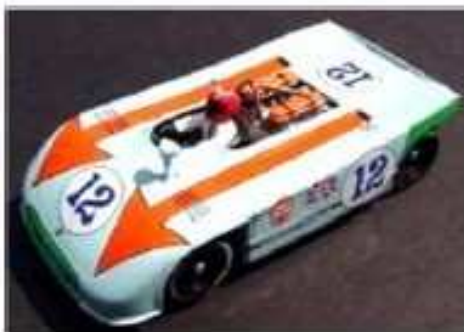
FLY Porsche 908/3