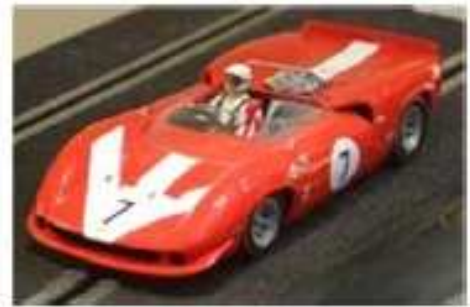
REVELL Lola T70 Spider