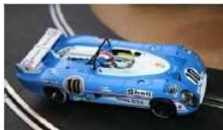
SRC Matra 670B

Amnesso sostituzione assale con cerchi e gomme della Fly