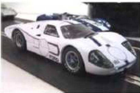
MRRC Ford GT MKIV