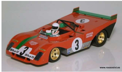
Sloter Ferrari 312 PB