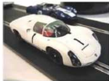
MRRC Porsche 910