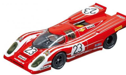
Carrera Porsche 917K