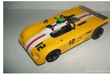
Sloter Lola T 280