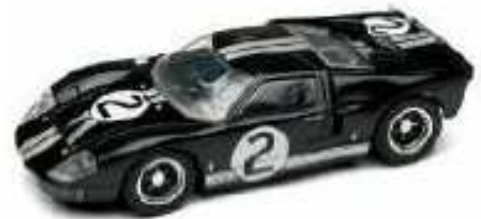
SCALEXTRIC Ford GT40 MKII