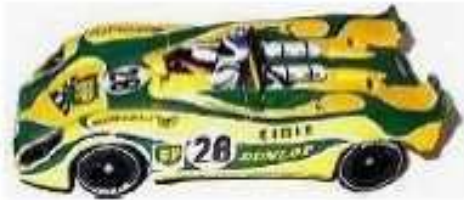
FLY Porsche 908 Flunder