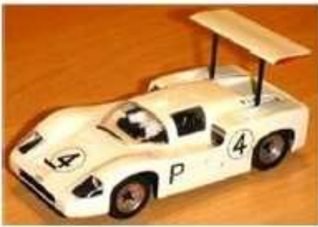
MRRC Chaparral 2F