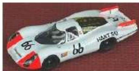
SRC Porsche 907L

Amnesso sostituzione assale con cerchi e gomme della Fly