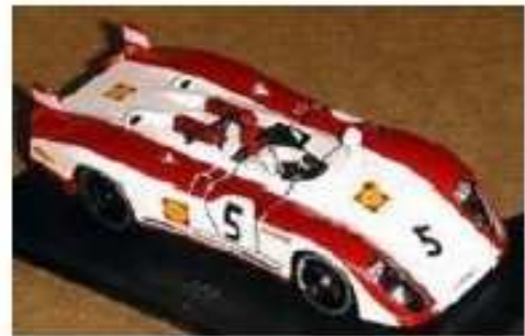
FLY Porsche 908 Flunder LH