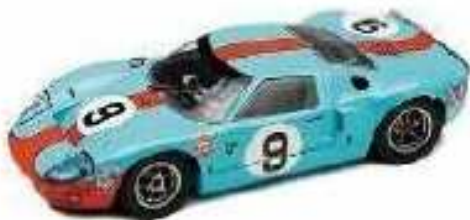
SCALEXTRIC Ford GT40