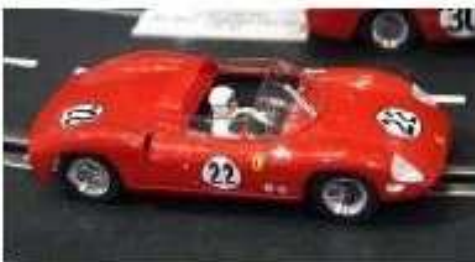
REVELL Ferrari 275P