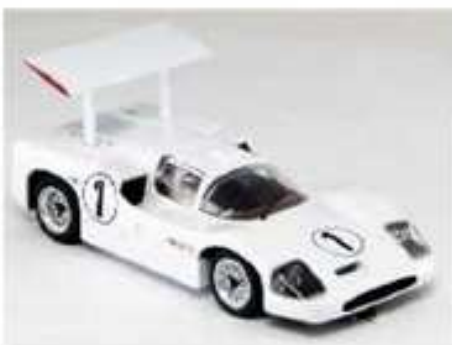
SCALEXTRIC Chaparral 2F