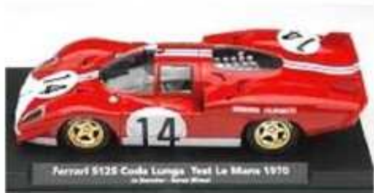
FLY Ferrari 512 LM