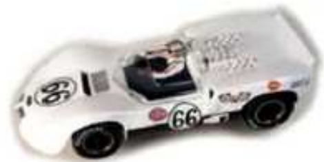
MRRC Chaparral 2C