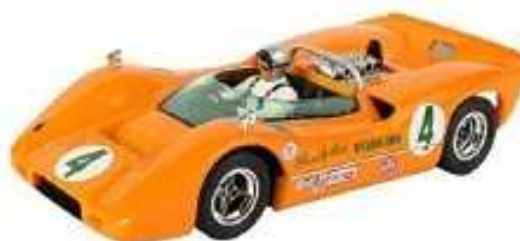
Revell McLaren M6