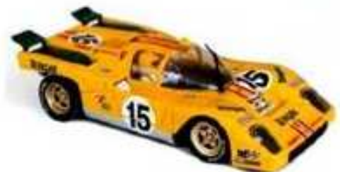
SPIRIT Ferrari 512 LM