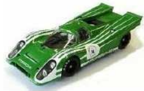
FLY Porsche 917 Ammessa la rimozione della ruota di scorta