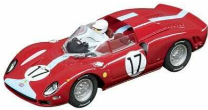
Carrera Ferrari 365 C2