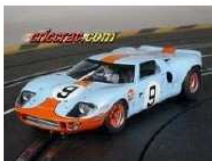
FLY Ford GT40