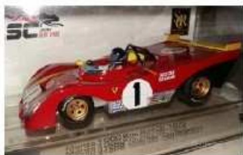
SRC Ferrari 312 pb (1972)