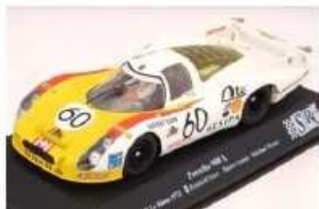
SRC Porsche 908 (1972)

Amnesso sostituzione assale con cerchi e gomme della Fly