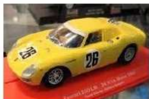
FLY Porsche 250 LM