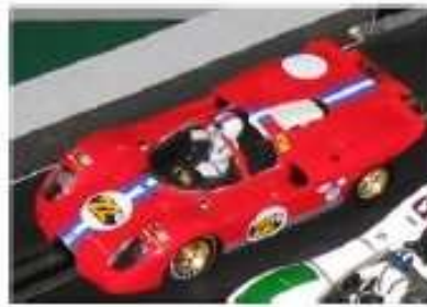
FLY Ferrari 512 Spider