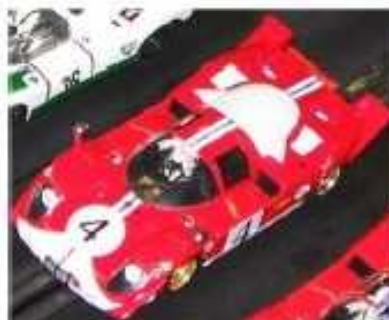
FLY Ferrari 512 S Berlinetta