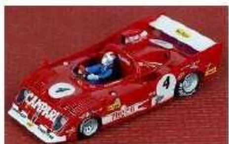
SRC Alfa Romeo 33TT12

Amnesso sostituzione assale con cerchi e gomme della Fly