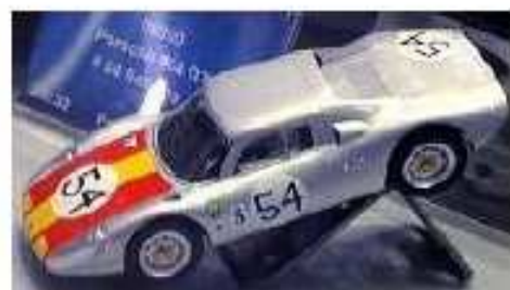
REVELL Porsche 904 GTS