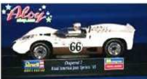
REVELL Chaparral 2C